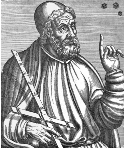
(คลอดีอุส ปโตเลมี)

วิชาโหราศาสตร์ภารตะ(HINDU ASTROLOGY) ได้รับความนิยมนศึกษากันพอสมควรทั้งในประเทศอินเดีย และ ประเทศไทย