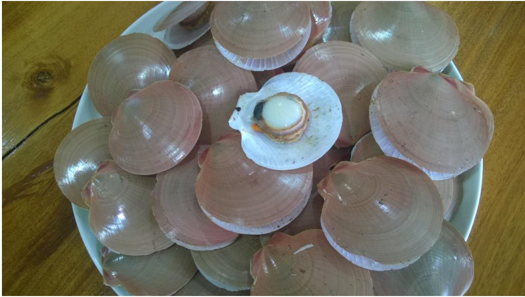
หอยเชลล์สดนึ่งพอดีสุก จัดฝานออกเห็นเนื้อหอยเต่ง มีให้กินทั้งกินขว้าง