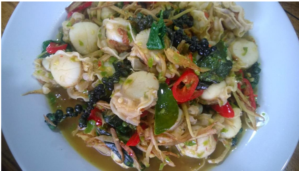
หอยเชลล์ยังเหลืออีกมาก จึงแกะเอาแต่เนื้อมาผัดนำใส่กระชาย พริกไทยอ่อน ใบมะกรูด โขลกเครื่องแกงรสชาติโลด โผนสุดฤทธิ์สุดเดช