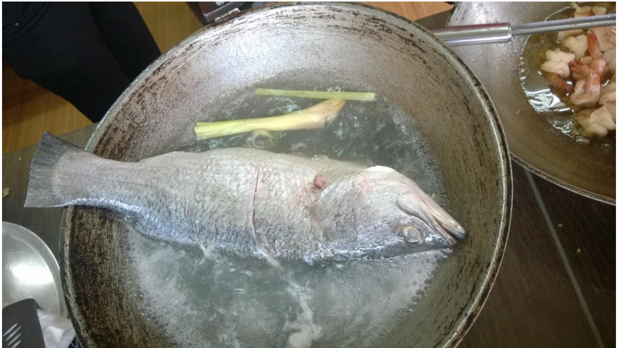
แอบย่องเข้าครัวดูเบื้องหลังการนึ่งปลากะพงขาว