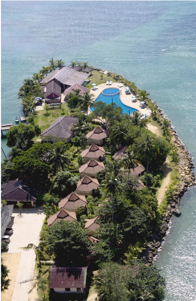
ภาพถ่ายทางอากาศของ โครัล รีสอร์ท

วันหยุดพักผ่อนชายทะเลในฝัน มีห้องพักระดับมาตรฐาน ให้เลือกหลากหลายประเภทและขนาด มีการตกแต่งอย่างเรียบง่ายสะอาดตาพร้อมด้วยสิ่งอำนวยความสะดวกครบครัน ค่ำกับเครื่องดื่มและอาหารทะเลรสดีบรรยากาศริมคลอง พร้อมชื่นชมวิวยามพระอาทิตย์ตกดิน