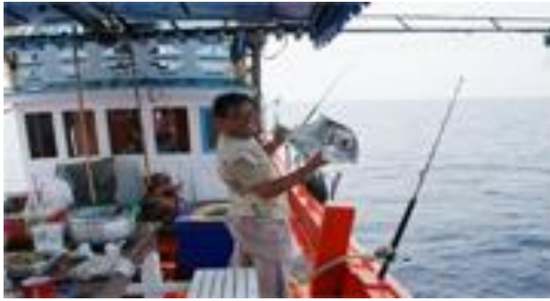
พิกำนันวันรุ่ง ฆนรกุล เจ้าองรืสอ์รท โฆว์ปลาโณมงามตัวโตที่ตกได้