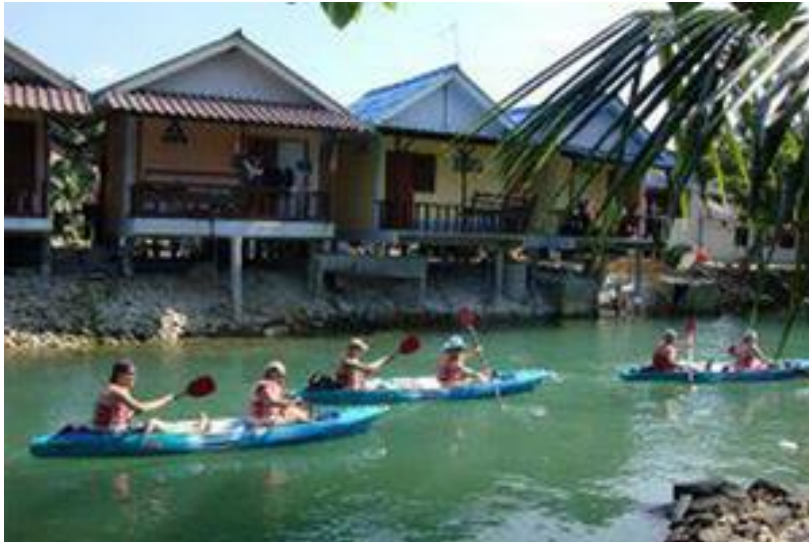
นักท่องเที่ยวฝรั่งสนุกสนานกับเรือแคนูในคลองไถ่แบ้