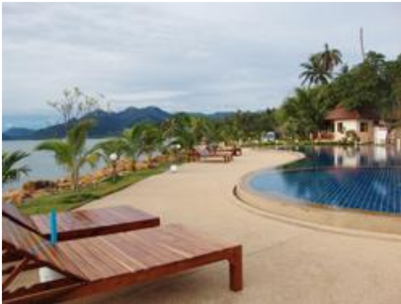
สระว่ายน้ำของรีสอร์ท