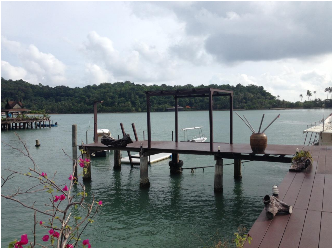
ลาที่เกาะช้าง รำลากันอย่างอาดัยอวารณ์