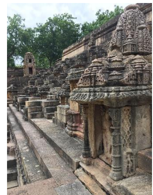
พินา ที่ 1 (BHIMA I) ในสมัยราชวงศ์ ชัวลุกยา

(CHAULUKYA DYNASTY) เป็นวิหารที่สร้างตามแบบสถาปัตยกรรมวิหารของอินเดีย มี มณฑปสำคัญสำหรับรูปเคารพของเทพเจ้า และ มณฑป สำหรับให้นักดนตรี และ นางระบำ เล่นดนตรีและรำถวายเทพเจ้า ถัดออกมาก็เป็น อาคารเก็บน้ำใต้ดิน ที่สร้างอย่างสวยงาม เกินกว่าจะเป็นบ่อเก็บน้ำ เพราะเต็มไปด้วยรูปสลักที่ทำอย่างละเอียดประณีต มีความลึกลง ไปจากพื้นดินเท่ากับ อาคาร 5 ชั้น นอกจากนี้จะใช้ในการเก็บกักน้ำสำหรับฤดูแล้งแล้ว ยังใช้ สำหรับการบูชาเทพเจ้าอีกด้วย